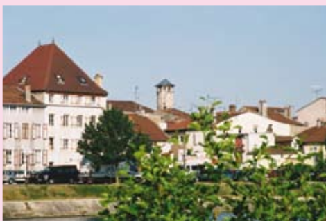
Vue sur St Jean

16 Square Winston Churchill : Le boulevard de Lattre de Tassigny et le square Winston Churchill ont remplacé la rue des Moulins et le vieux quartier qui bordait la rivière au bas du pont. En fait, on a édifié une terrasse qui sert de digue depuis l'ancien moulin, dont il reste une pile, jusqu'au pont. C'est le square Winston Churchill, aménagé en jardin public en mémoire du vieux lion britannique (1874-1965) qui lutta de toute son énergie contre le nazisme et sut maintenir le moral de l'Angleterre au cours d'une guerre qui fut la pire de son histoire. Un monument y est érigé pour rendre hommage aux passeurs de la Guerre 14-18.