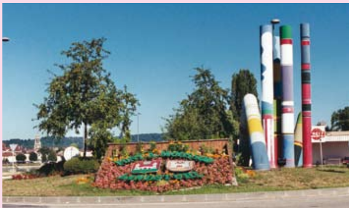
Entrée sud, parterre du jumelage avec Landstuhl - Allemagne