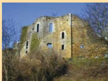
Chapelle dite des Templiers